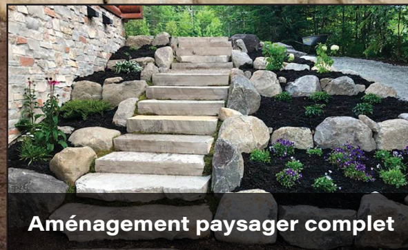
Aménagement paysager complet