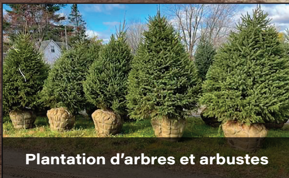
Plantation d'arbres et arbustes