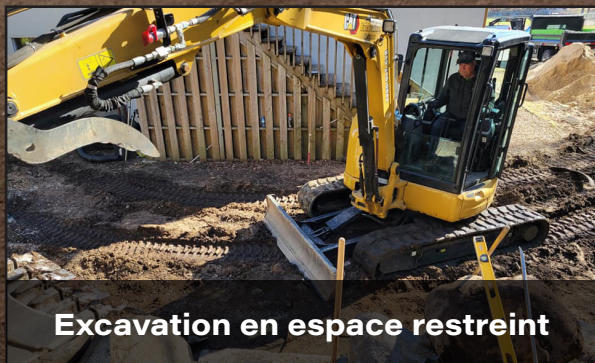
Excavation en espace restreint