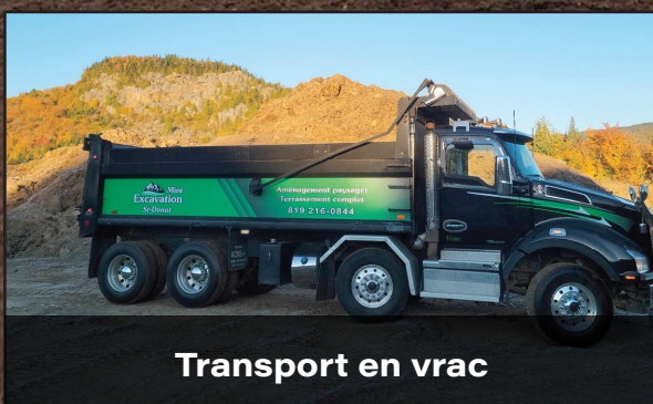
Transport en vrac