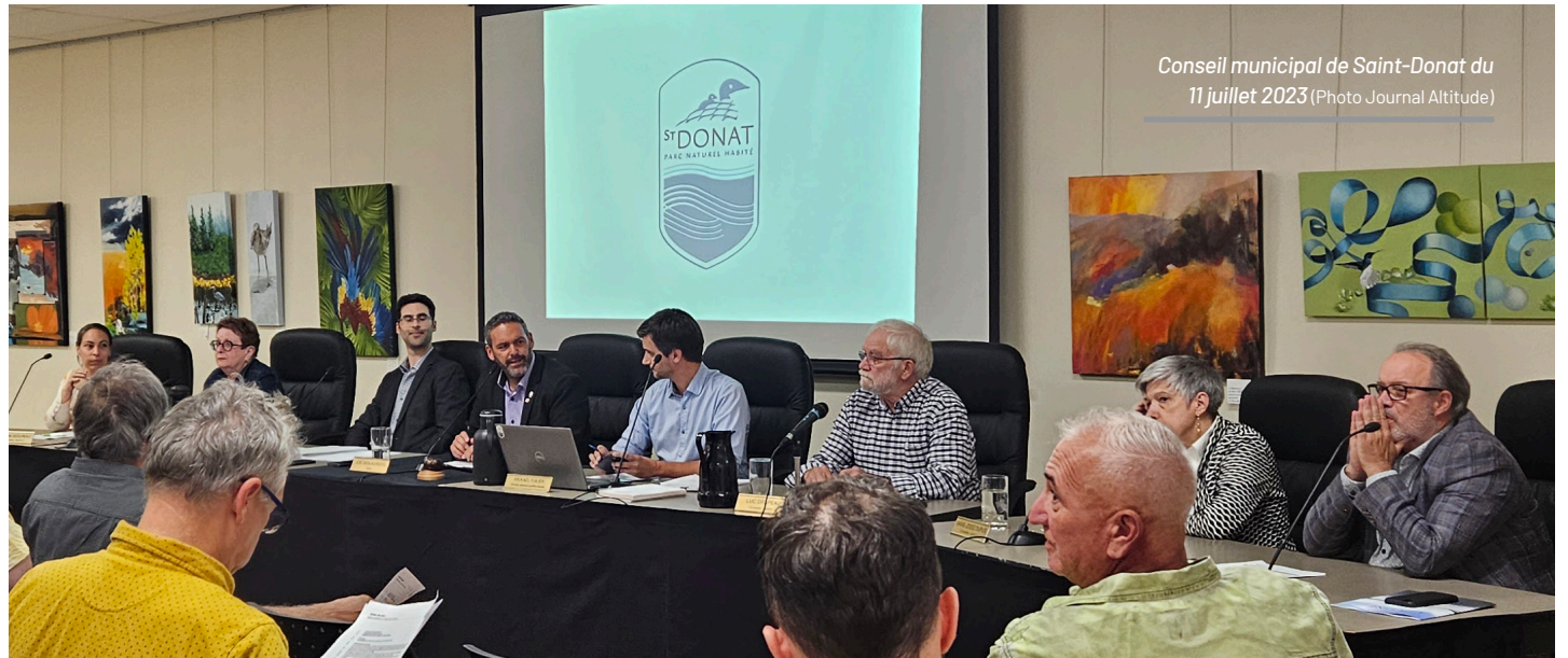
Conseil municipal de Saint-Donat du 11 juillet 2023