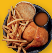
Cuisse de poulet