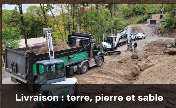
Livraison : terre, pierre et sable