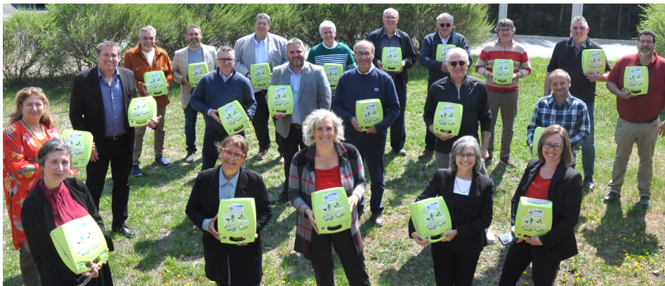
Les mairesses et les maires de la MRC des Laurentides et le maire de Saint-Donat sont heureux de constater que les défibrillateurs offerts sont identiques à ceux qui sont utilisés par les paramédics.

Rappelons que la mission de la Fondation