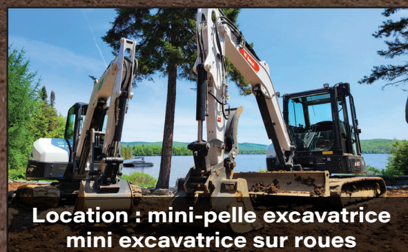
Location : mini-pelle excavatrice mini excavatrice sur roues