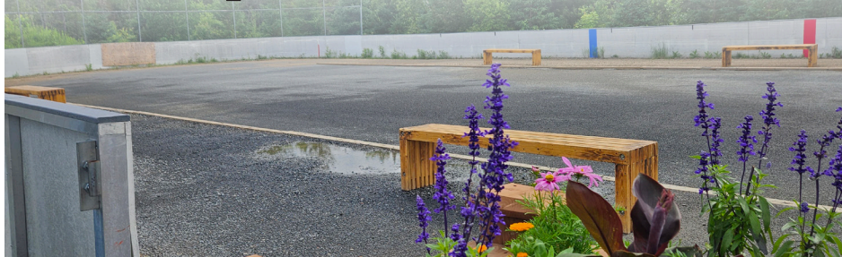
Le nouvel emplacement du jeu de pétanque à l'intérieur de la patinoire du parc des Pionniers.