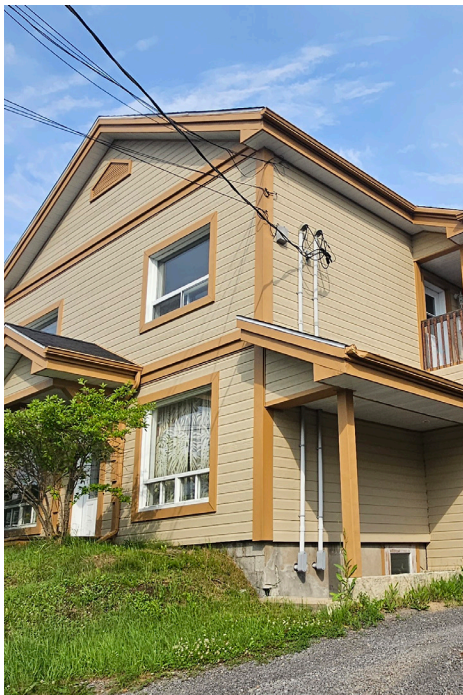
La portion inhabitable du 375 rue Bellevue au cours de l'année 2022 est située en bas à droite de l'édifice.